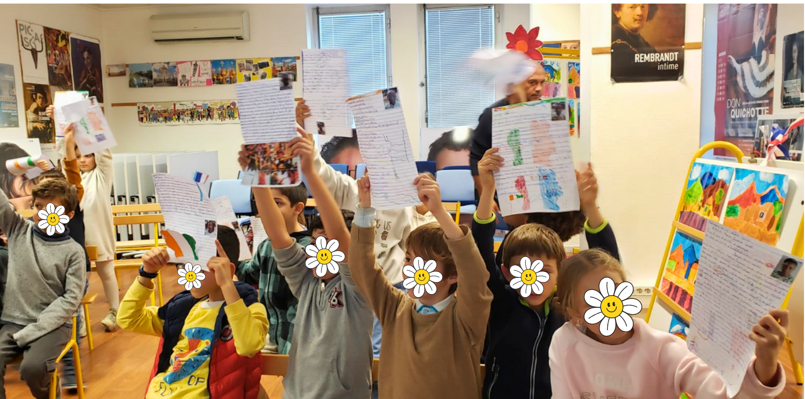
Réception des lettres à Nice pour la correspondance France - Abidjan